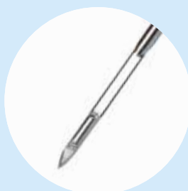
Pos. 1: Para muestra de 10 mm