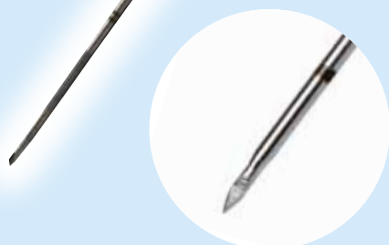
Pos. 0: Posición Inicial